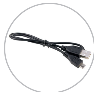
CAVO USB C