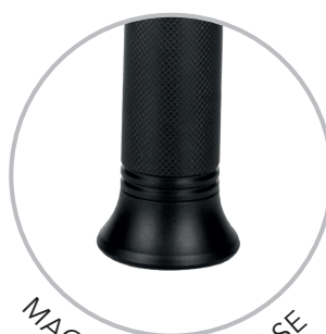
MAGNETE ALLA BASE