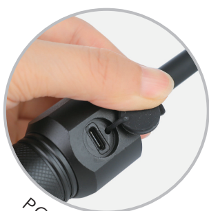
PORTA USB C