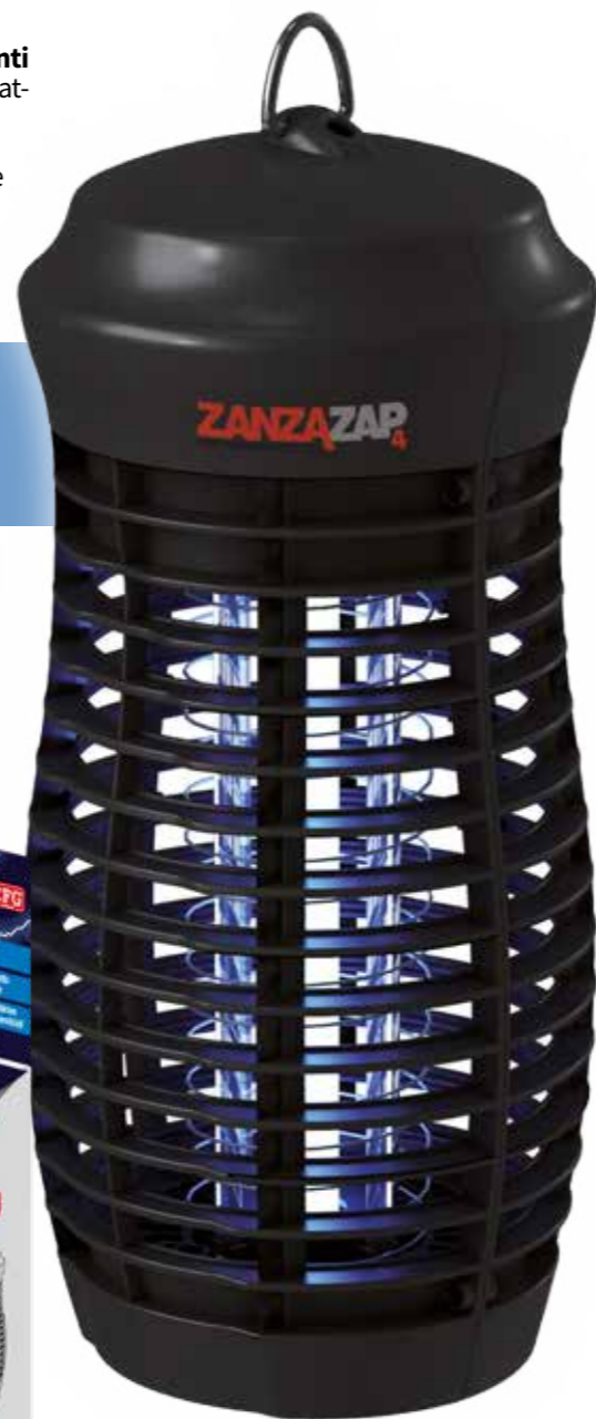
Lampada di ricambio COD. EZ023L