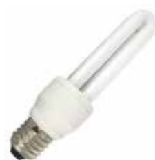
Lampada di ricambio COD. E334R