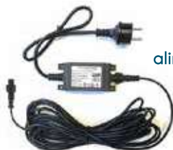
Cavo di alimentazione