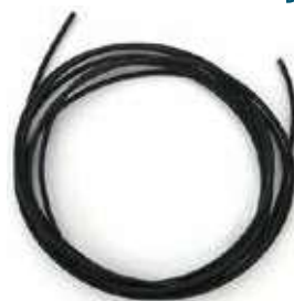
Tubo in gomma per trasporto CO 2