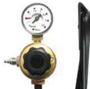
Regolatore di pressione