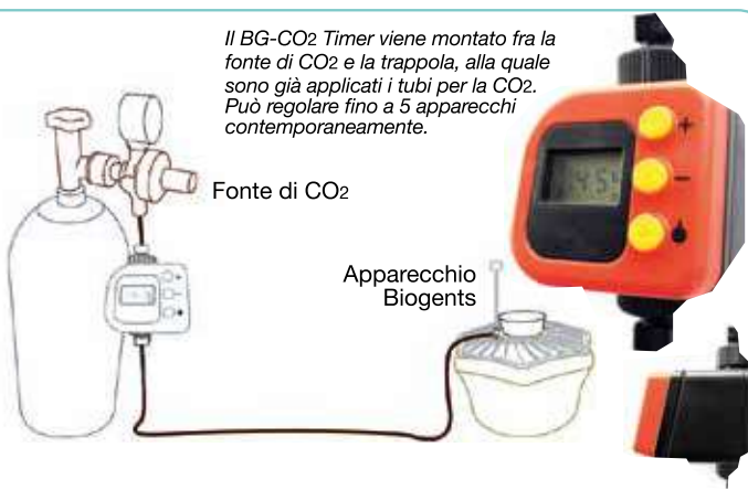
Fonte di CO 2

Il BG-CO 2 Timer viene montato fra la fonte di CO 2 e la trappola, alla quale sono già applicati i tubi per la CO 2 . Può regolare fino a 5 apparecchi contemporaneamente.