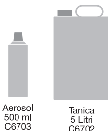
Aerosol 500 ml C6703