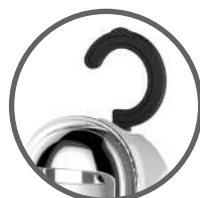
Gancio a scomparsa per trasportare o appendere la lampada