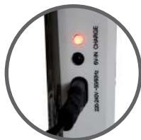
Spia LED indicatore di ricarica batteria e della funzione di emergenza inserita.