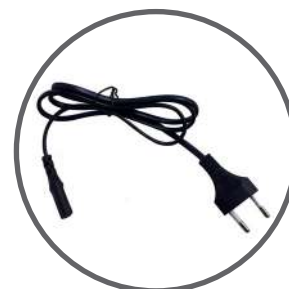
Caricabatterie: 220V incluso