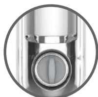
Variatore di intensità luminosa.

La lampada si accende automaticamente in caso di black-out elettrico.