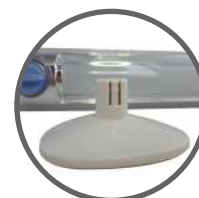
Basamento per sostenere la lanterna in posizione verticale.