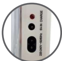
Prese per caricabatterie 220V e 6V