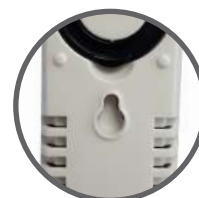
Asola per appendere la lampada a una superficie verticale